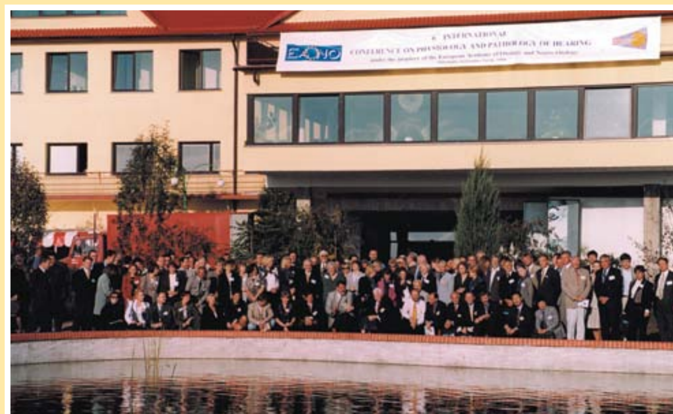
Uczestnicy konferencji Traditional commemorative photograph of the participants

W Galerii Porczyńskich w Warszawie odbyło się otwarte spotkanie dla mieszkańców Warszawy pod hasłem „Lepiej słyszę – lepiej żyję”, które było jednocześnie podsumowaniem II Ogólnopolskiego „Tygodnia Słuchu w Mediach” – 19 września.