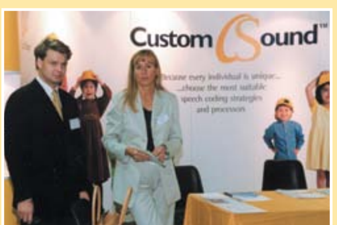
Konferencji towarzyszyła wystawa firmy Cochlear i firmy MED-EL Exhibition of the collaborating firms accompanied the Conference: Cochlear and MED-EL