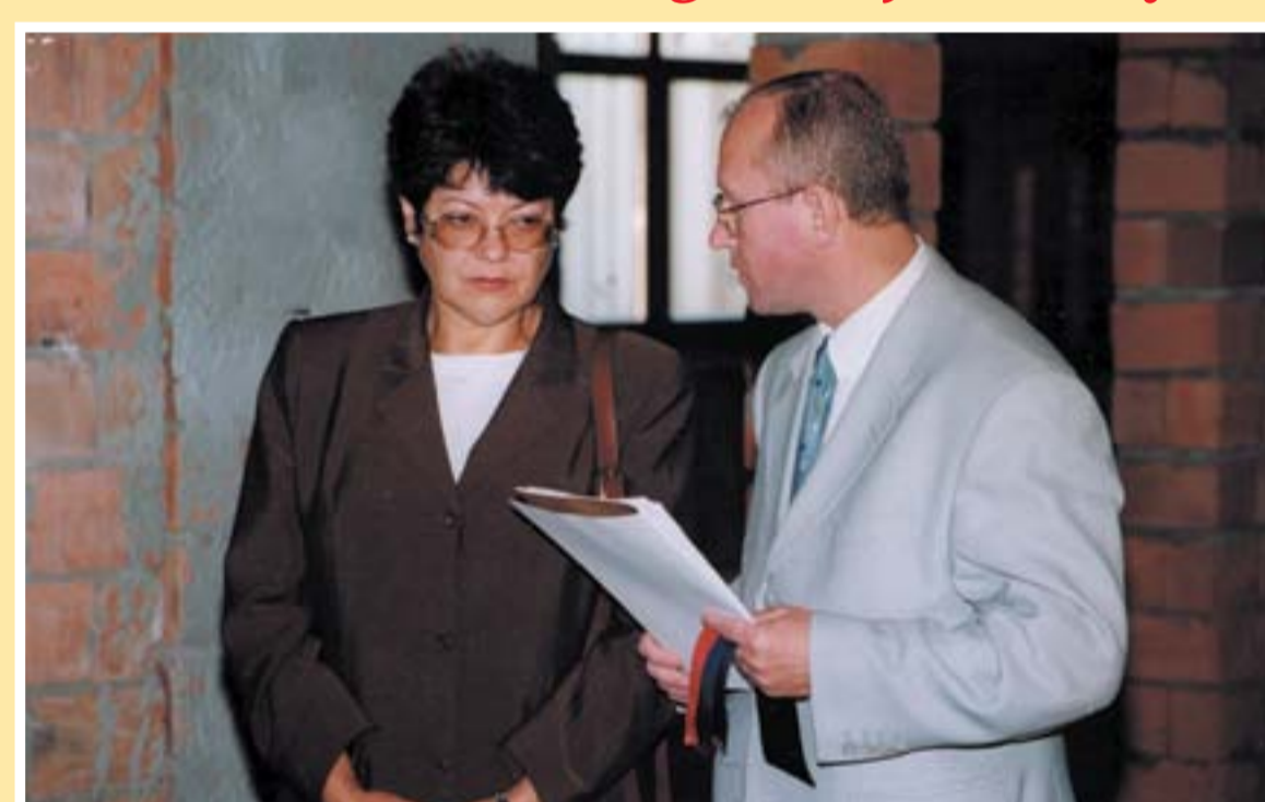
Forum Rodziców i Organizacji Pozarządowych odbyło się na terenie budowy Międzynarodowego Centrum Leczenia Zaburzeń Słuchu w Kajetanach – gościem honorowym była Minister Zdrowia – pani Franciszka Cegielska

Forum Rodziców i Organizacji Pozarządowych – 12 września / Forum of Parents and Non-Government Organizations – 12 of September