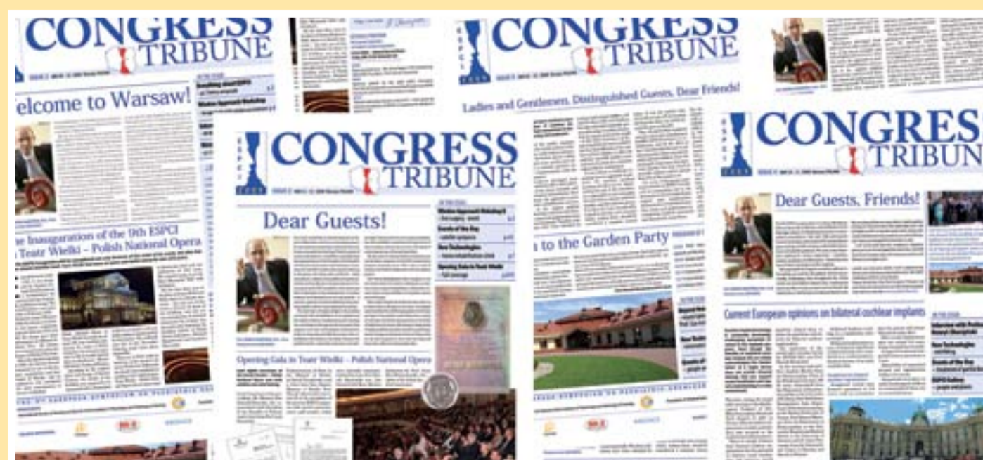
Niezwykły ważny i nowatorski element konferencji – codzienna gazeta „Congress Tribune”, która była dla uczestników konferencji dodatkowym źródłem informacji Extraordinary, important and innovative element of the Conference – daily newspaper “Congress Tribune” which was the source of additional information for the participants