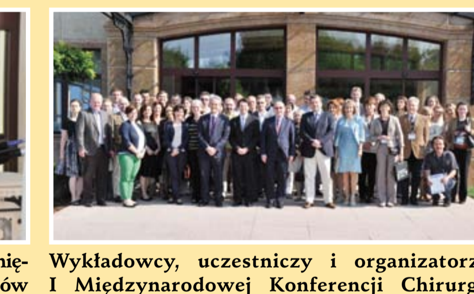
Wykładowcy, uczestnicy i organizatorzy I Międzynarodowej Konferencji Chirurgii Endoskopowej Zatok i IV Międzynarodowego Kursu Chirurgii Endoskopowej Zatok Lecturers, participants and organizers of the I International Conference of the Endoscopic Paranasal Sinus Surgery and the IV International Course in the Endoscopic Sinus Surgery

Spotkanie Ministrów Zdrowia krajów Unii Europejskiej – Sopot, 5–6 lipca. Meeting of Health Ministers of the European Union Countries – Sopot, 5 th –6 th of July.