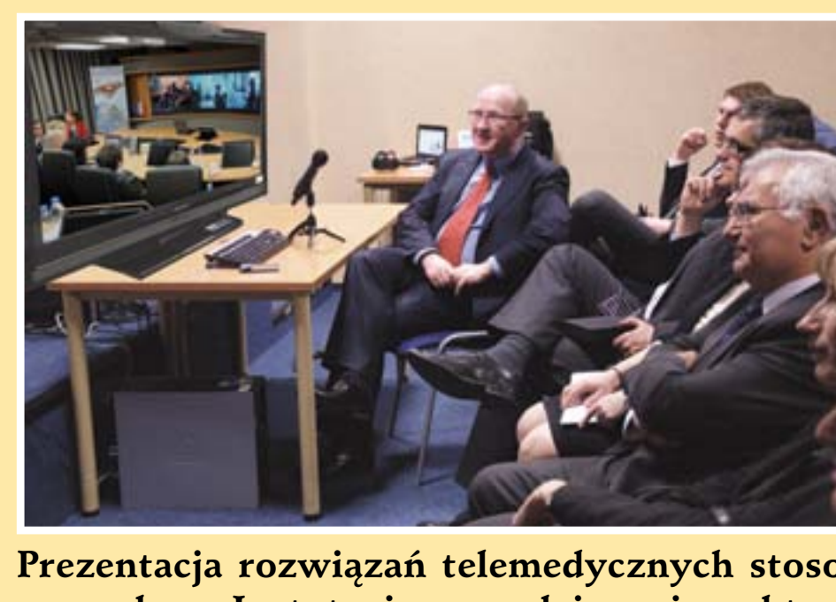
Prezentacja rozwiązań telemedycznych stosowanych w Instytucie w codziennej praktyce klinicznej Presentation of telemedical solutions used at the Institute in everyday clinical practice