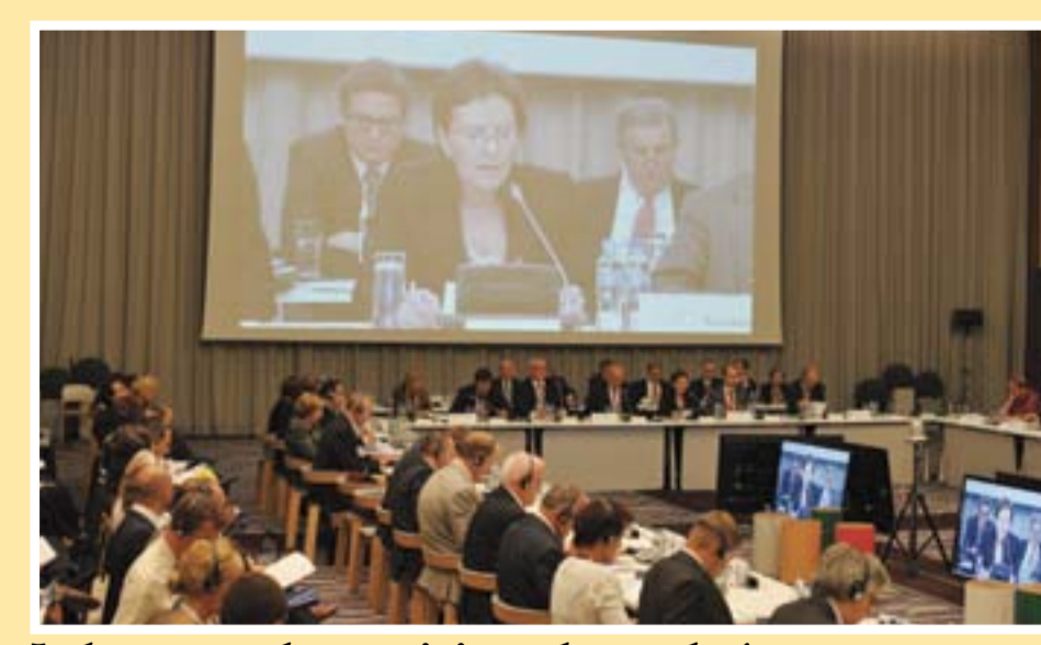
Jednym z obszerniejszych punktów programu była prezentacja przez Panią Minister Zdrowia Ewę Kopaczkę priorytetu nt. wyrównywania szans dzieci z zaburzeniami komunikacyjnymi, a następnie wykład prof. Henryka Skarżyńskiego poświęcony temu zagadnieniu oraz prezentacja polskich osiągnięć w zakresie prowadzenia programów skriningowych na dużą skalę One of the most extensive subjects of the meeting was presentation of the Priority on the Equal opportunities for children with communication disorders by the Minister of Health Ms. Ewa Kopacz. Next, Prof. Henryk Skarżyński gave a lecture on the subject and presented Polish achievements in conducting large scale screening programs

W pierwszych dniach polskiej prezydencji w Radzie UE odbyło się w Sopocie spotkanie Ministrów Zdrowia krajów UE, które zainaugurowało polskie przewodnictwo w obszarze opieki zdrowotnej. During the first days of the Polish presidency in the European Union Council a meeting of Health Ministers of the European Union, which opened Polish leadership in the region took place in Sopot.