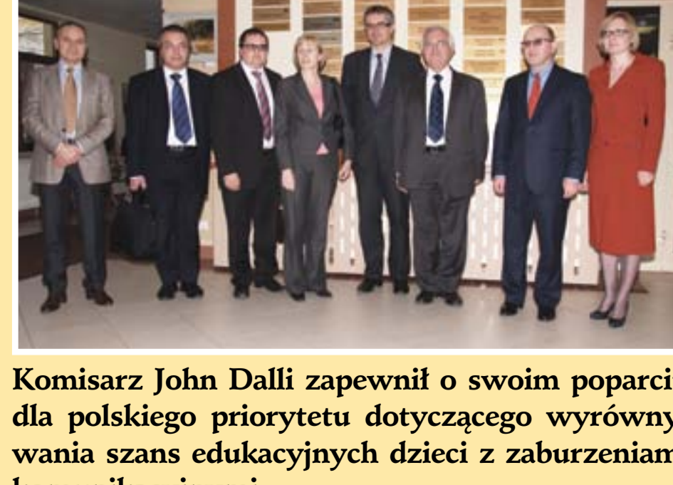
Komisarz John Dalli zapewnił o swoim poparciu dla polskiego priorytetu dotyczącego wyrównywania szans edukacyjnych dzieci z zaburzeniami komunikacyjnymi Commissionary Mr. John Dalli assured his support for Polish Priority on the Equal opportunities for children with communication disorders

I Międzynarodowa Konferencja Chirurgii Endoskopowej Zatok – 9–11 czerwca. I International Conference of the Endoscopic Paranasal Sinus Surgery – 9 th –11 th of June. IV Międzynarodowy Kurs Chirurgii Endoskopowej Zatok – 9–11 czerwca. IV International Course in the Endoscopic Sinus Surgery – 9 th –11 th of June.