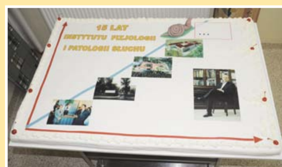
Okolicznościowy tort w słodkiej polewie – przeszłość, teraźniejszość i przyszłość Instytutu Occasional layer cake with sweet coating – the past, the present and the future of the Institute