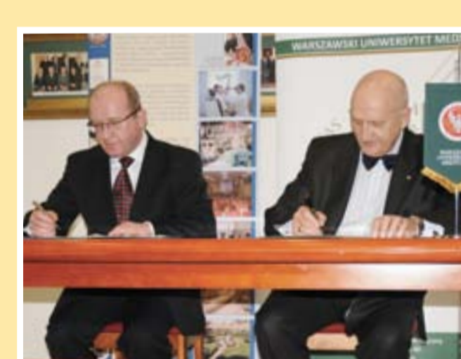
Podpisanie umowy i wymiana dokumentów o współpracy naukowo-dydaktycznej Subscription of the agreement and exchange of documents regarding scientific and didactic collaboration

Pan John Dalli – Komisarz Unii Europejskiej ds. Zdrowia i Polityki Konsumenckiej w Międzynarodowym Centrum Słuchu i Mowy – 19 kwietnia.