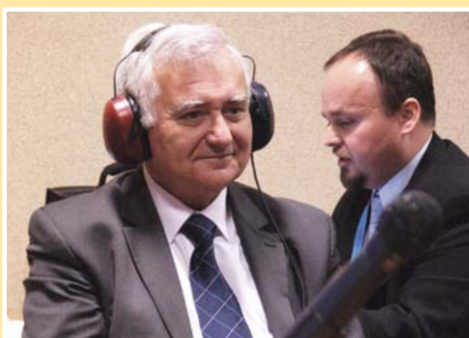
Komisarz John Dalli w trakcie przesiewowego badania słuchu Mr. John Dalli during hearing screening examination

On the eve of Polish presidency of the European Union Council – the European Union Commissary for Health and Consumers Policy Mr. John Dalli and representatives of his cabinet as well as representatives of European Commission in Poland visited the International Center of Hearing and Speech. Main subject of the meeting concerned the European project of hearing, vision and speech screening in school age children and also examples of telemedicine and its pioneer solutions which were implemented by the team of the Institute of Physiology and Pathology of Hearing.