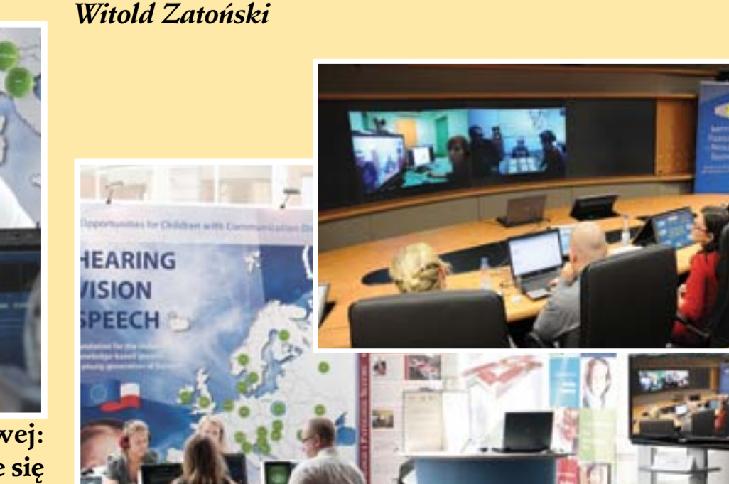
Studio telemedyczne w Sopocie i w Kajetanach Studio of telemedicine in Sopot and in Kajetany